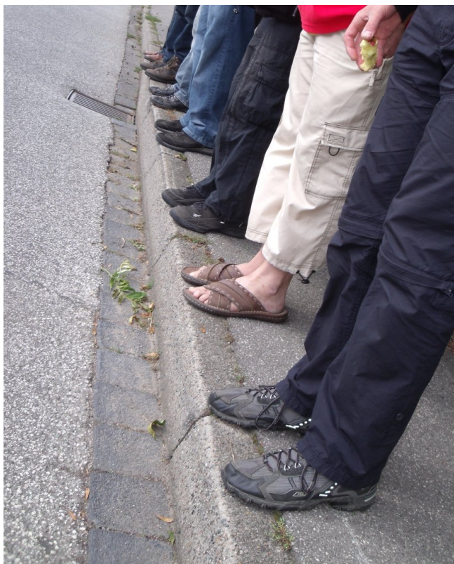
Teilnehmer - unterer Teil

dem Campingplatz - ließ sich dann sogar für einen Moment die Sonne blicken; so konnten wir wieder wie am Donnerstag direkt an der Elbe grillen.