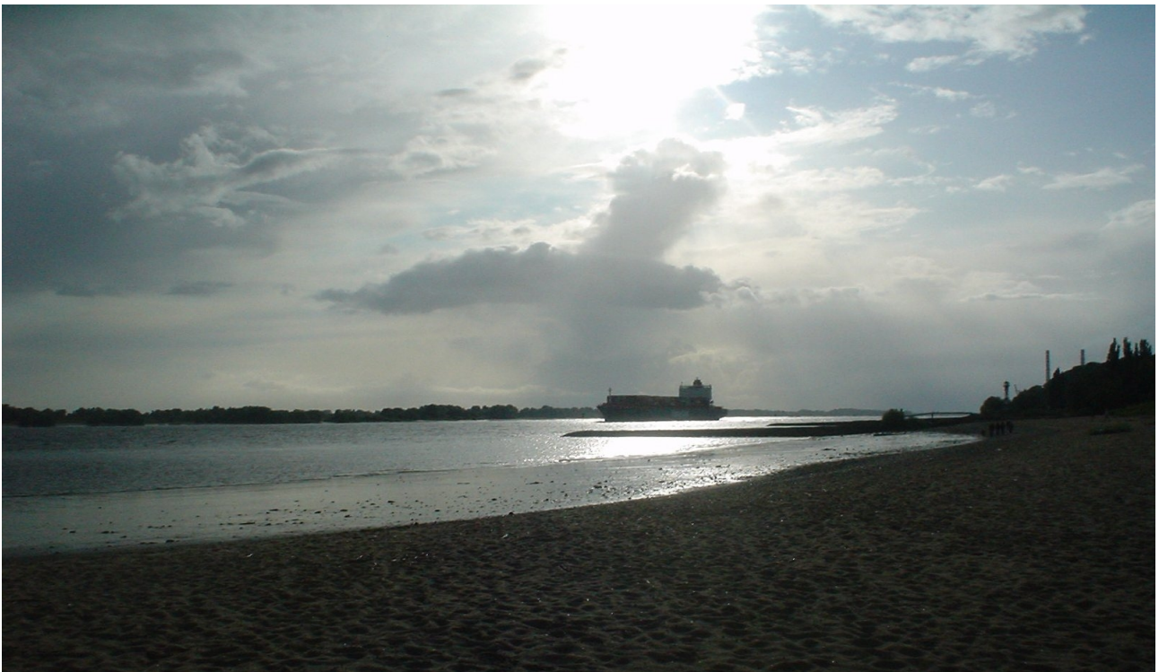
Elbstrand in Wittenbergen

Zum zweiten Mal gab es ein Sommercamp auf dem Elbecampingplatz in Hamburg. Dieses Jahr waren wir 10 Teilnehmer, von denen 7 auf dem Campingplatz übernachtet haben. Zusätzlich hatten uns noch 4 Interessierte aus Hamburg oder dem Hamburger Umland besucht. Auf dem Platz hatten wir ein zusätzliches „Gruppenzelt“, in dem wir nicht nur Sachen lagern konnten, sondern auch uns bei feuchterem Wetter trafen. Alles in allem hielt sich das mit dem feuchteren Wetter in Grenzen.